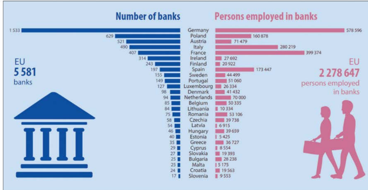
Figura 2 – EU: banche, numero e addetti, 2019*